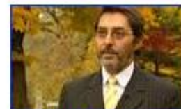
A sejtbe kódolt információ 2.