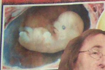
A magzat megismétli az anyaméhben a törzsfajlódást. Ez az evolúció egyik bizonyítéka, a két-hedek szerint azonban ez csak felszínes hasonlóság