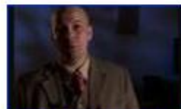
Mekkorát tévedhet a tudomány?