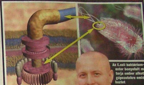
Az E.coli baktrétium-ostor bonyolult motortja ember alkotta gépezetekre emlékeztet