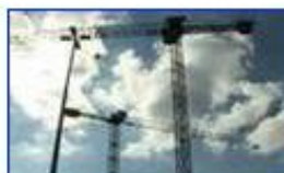
Evolúció kontra tervezettség