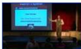
Fajon belüli változékonyság