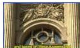
Evolution vs. Design