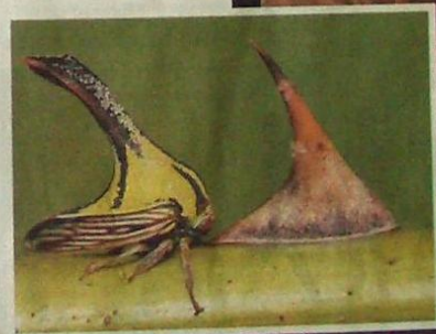
A püposkabóca nőténye pont olyan, mint a rózsá tüskéje. Milyen evolúciós folyamat vezethetett idáig?