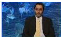
A meghökkentő DNS 1.