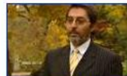
A darwinizmus kudarca