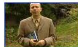
Nem ad választ az evolúció