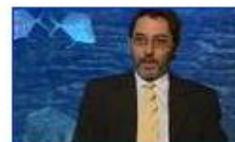
A meghökkentő DNS 2.