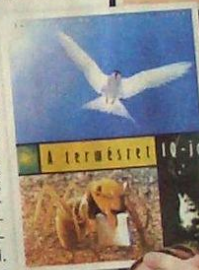
A természet IQ-ja című könyv olyan példákat hoz fel az élőlények alkalmazkodására, ami a szerzők szerint nem magyarázható az evolúcióval