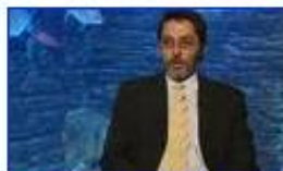
A meghökkentő DNS 3.