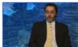
A meghökkentő DNS 4.