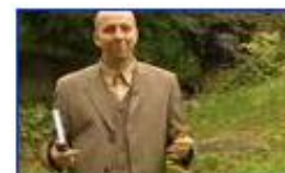
Mi van, ha nincs evolúció?