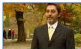
A sejtbe kódolt információ 1.