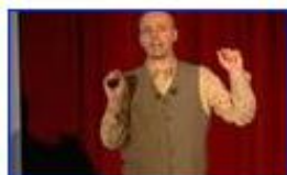
Embrionális hasonlóság vagy