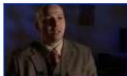
Egy felsőbb értelem lenyomata